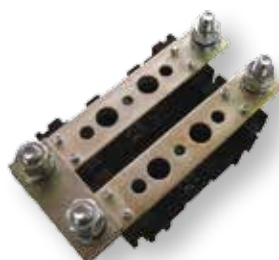
C-PLNS-00 + 2x PLNS-00N A